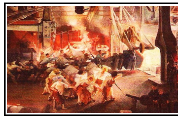
F. Bonhommé, fonderie d'Indret - détail - 1865 *

Indret et l'Arsenal aujourd'hui DCNS est à l'origine de la création de la commune de La Montagne en 1877 !