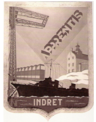
Blason des apprentis (arpettes) d'Indret 1940-41 *