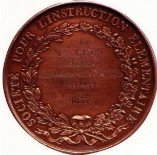
à Mme BRIN Directrice de l'école des jeunes filles d'Indret - 1855 *

Les élus de la majorité du conseil municipal d'Indre ont voté la fermeture de l'école d'Indret ! Honte à eux !